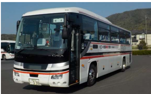
【松江一畑交通が運行する空港連絡バス】